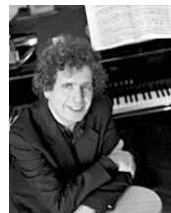
Le compositeur Michaël Lévinas est l'invité des Rencontres musicales de la Balinière.

Pratique. Rencontres musicales de la Balinière, samedi 8 novembre,